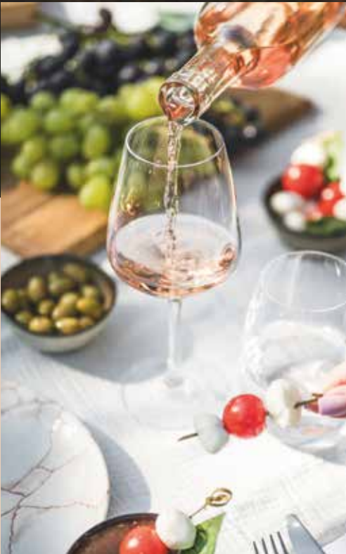
Between the Estérel and the Mediterranean... the vines

Sous le généreux soleil méditerranéen, ces terres, bénies par le soleil, dévoilent une richesse inouïe. Le terroir, né du feu des volcans et façonné par les âges, est sublimé par nos vignerons, héritiers d'un savoir-faire ancestral. Terre d'Estérel se démarque par ses rivages d'azur, la richesse de son patrimoine et la singularité de son terroir. C'est également un lieu où il fait bon vivre. Des marchés de Provence aux étals colorés, aux parties de pétanque endiablées, c'est une destination idéale pour partager, se retrouver, être ensemble.